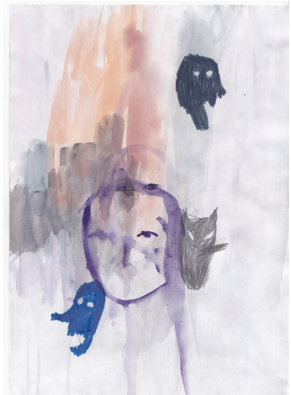
o.T. (aus: fantômes), 2022 Bleistift, Aquarell, Buntstift auf papier, 29,7 x 21 cm