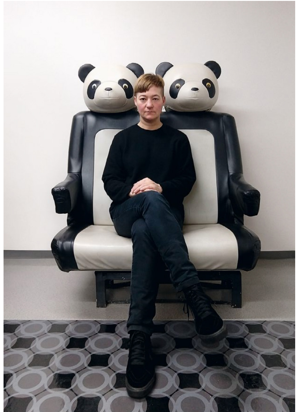
good news for modern man Postkarte, 2020