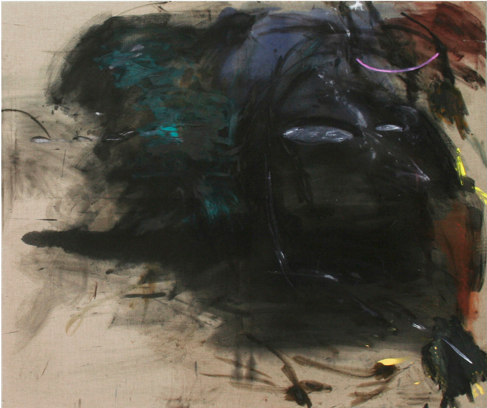
o. T. (Nuits sans nuits et quelques jours sans jour), 2017 Öl auf Leinen, 160 x 200 cm