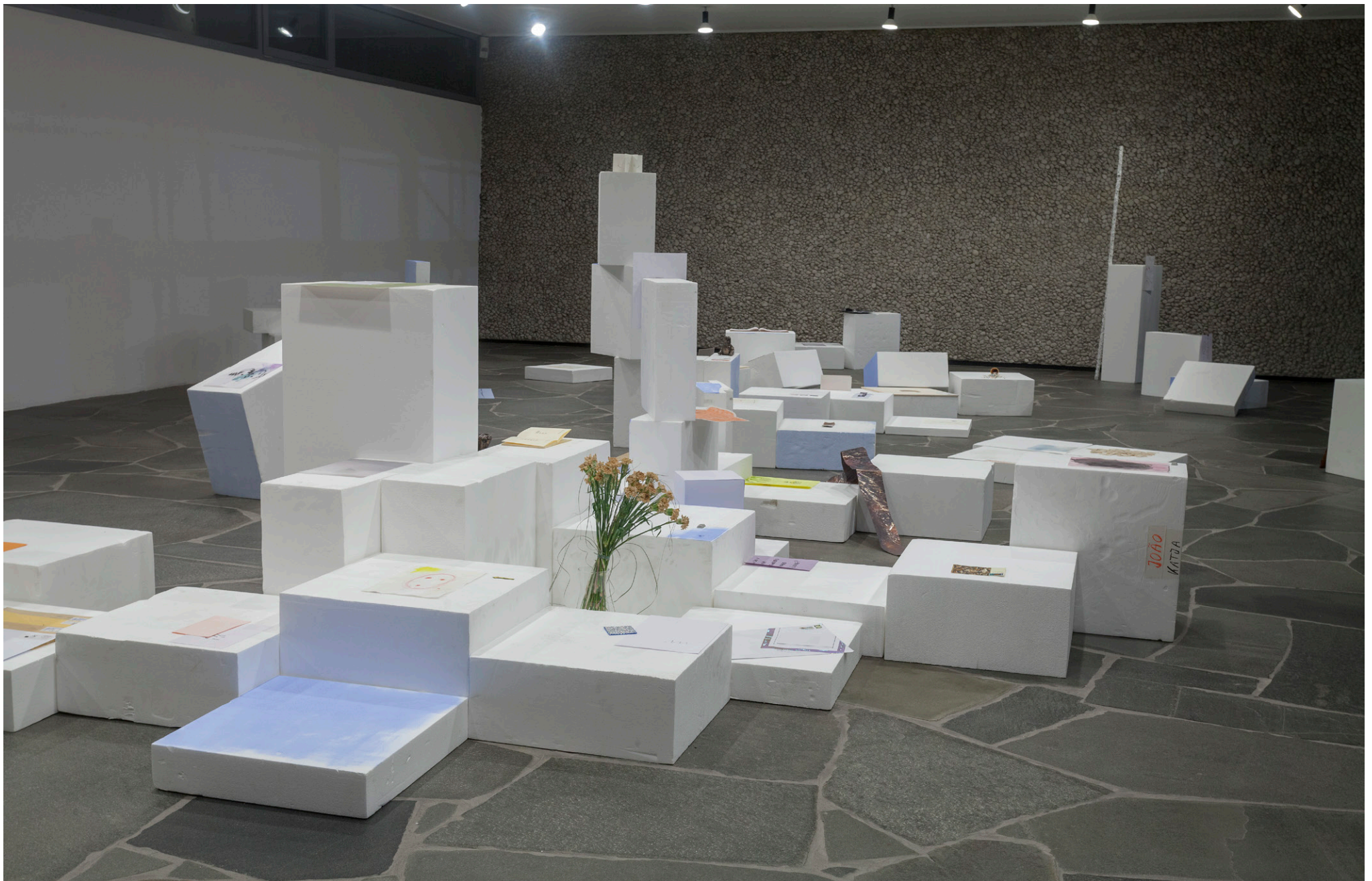
Installation Souvenir de Paris , 2023