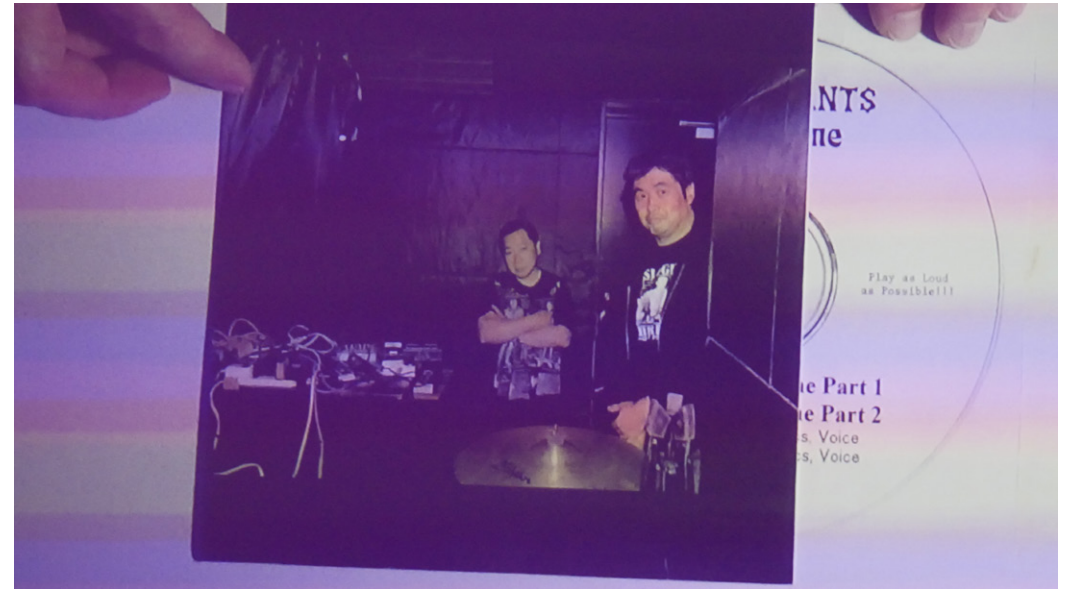
Projiziertes Plattencover der INCAPACITANTS

Die Veranstaltung widmet sich einem besonderen Aspekt zeitgenössischer Musik: der Arbeit mit Geräuschen, radikalen Soundlandschaften und Drones, die erst im Zuge einer langsamen Erweiterung tradierter Musik- und Kunstbegriffe in das Bewußtsein einer größeren Zahl von interessierten Menschen gelangte.