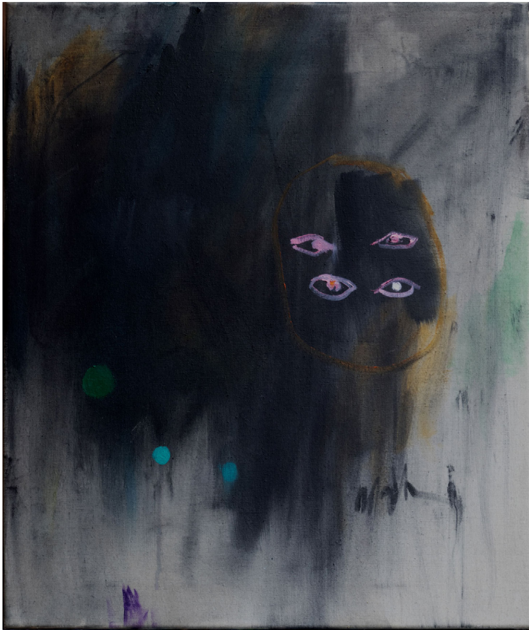
o.T. (aus: fantômes), 2023 Öl auf Leinen, 60 x 50 cm