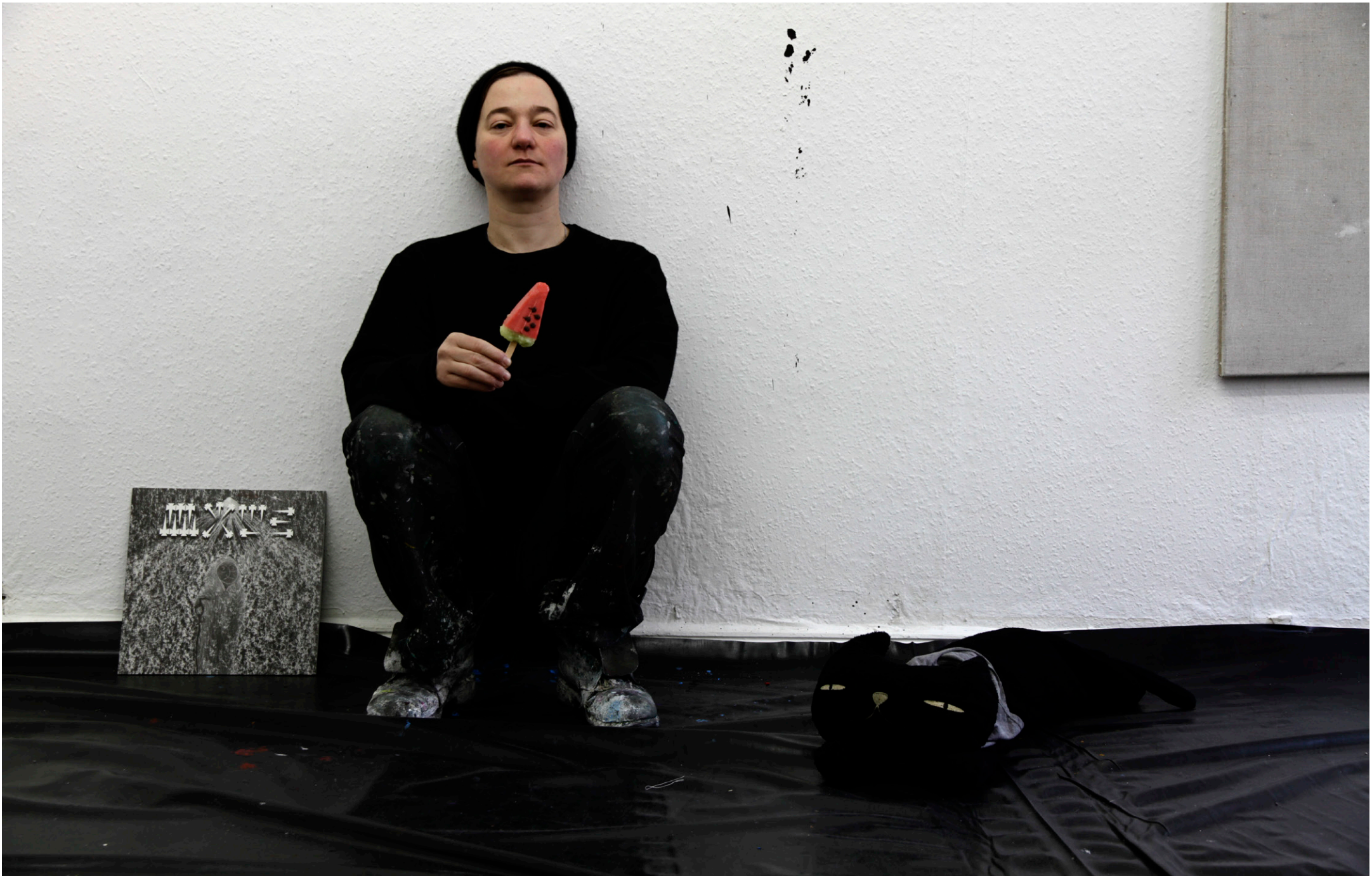
portrait of the artist as a painter (watermelon), 2021, Poster, 42 x 59,4 cm