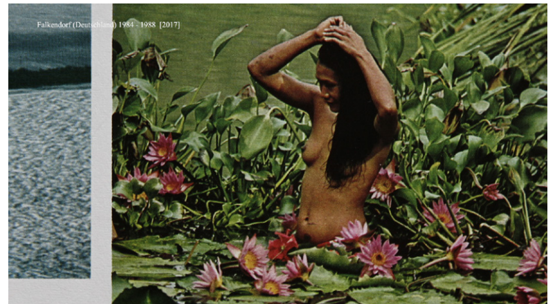
Stills aus: 母 Mother, HD Video, 22:55 min., 2021 https://vimeo.com/547901097 Passwort: rakun