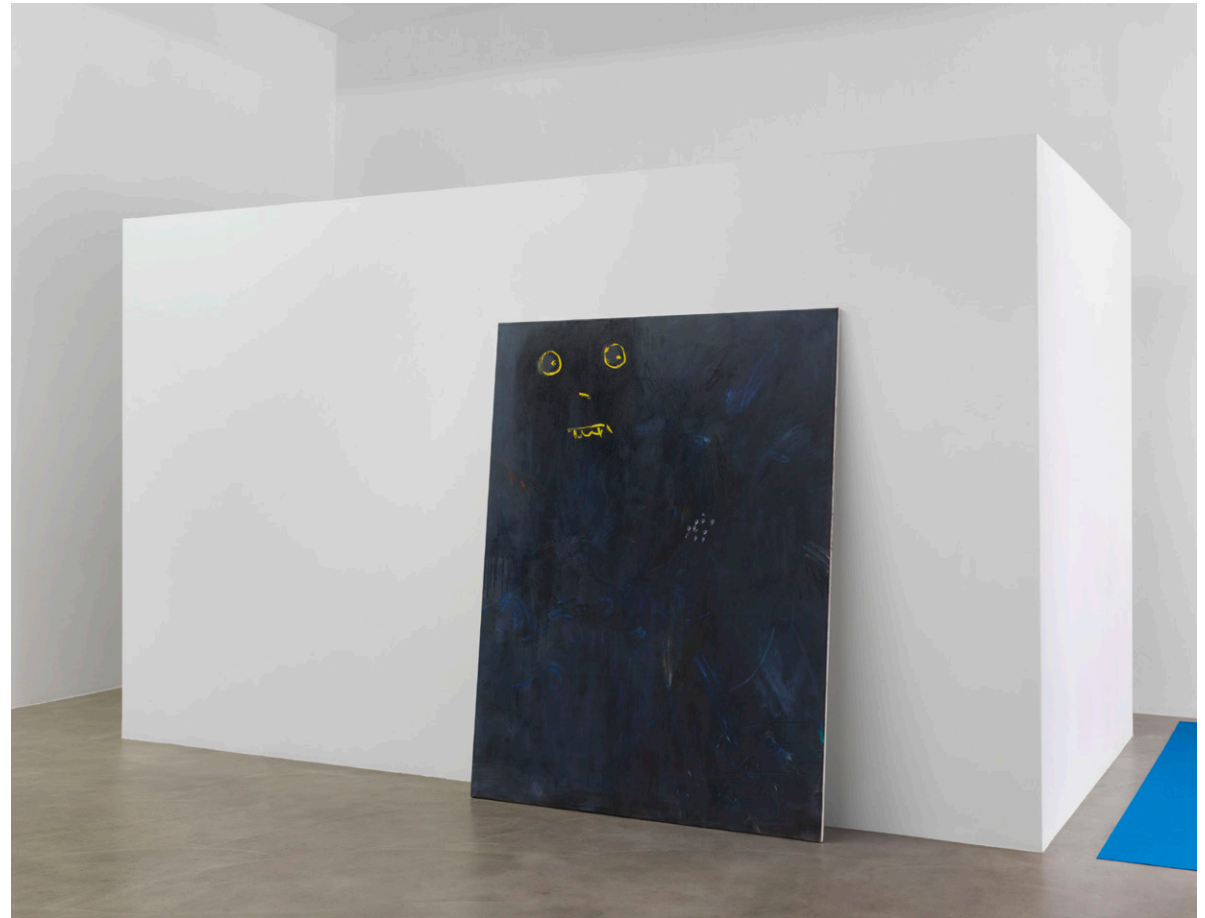
Ausstellungsansicht These Are the Only Times You Have Known , Neuer Berliner Kunstverein 2020

http://fraukeboggasch.de/media/Ghost_2020.mp3