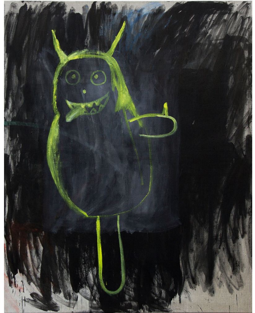
love, hate und Eismann, 2015/2020 Öl auf Leinen, 150 x 130 cm