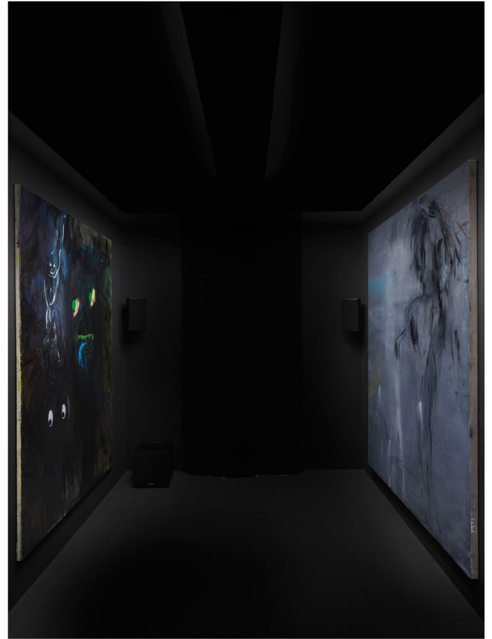
Ausstellungsansicht These Are the Only Times You Have Known , Neuer Berliner Kunstverein 2020