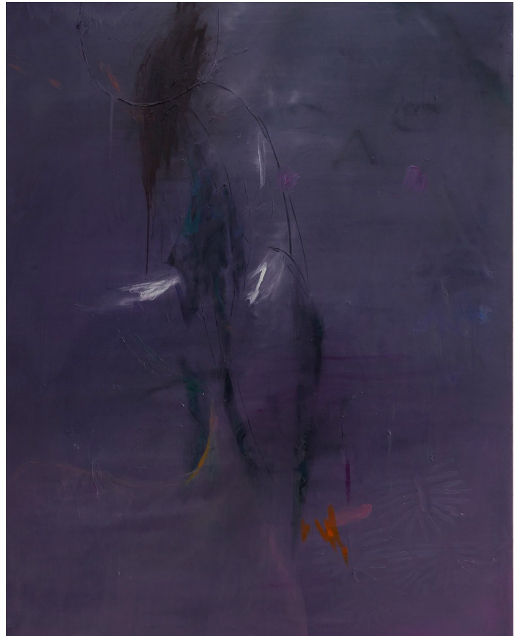
o.T. (ynh), 2020 Öl auf Leinwand, 200 x 150 cm