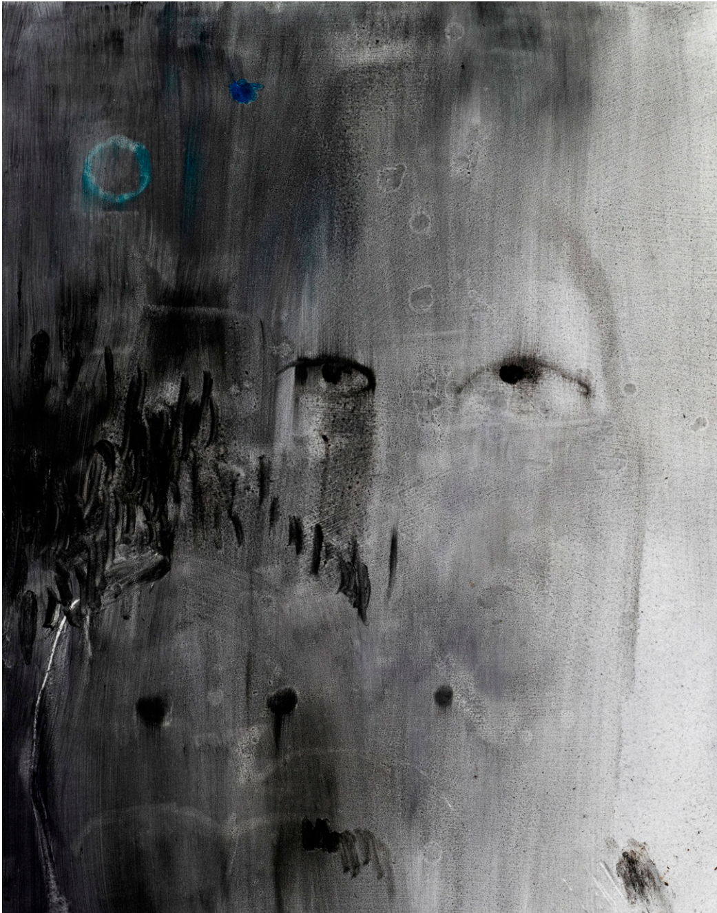
o.T. (fantômes), 2021 Öl auf Papier, 80 x 69 cm